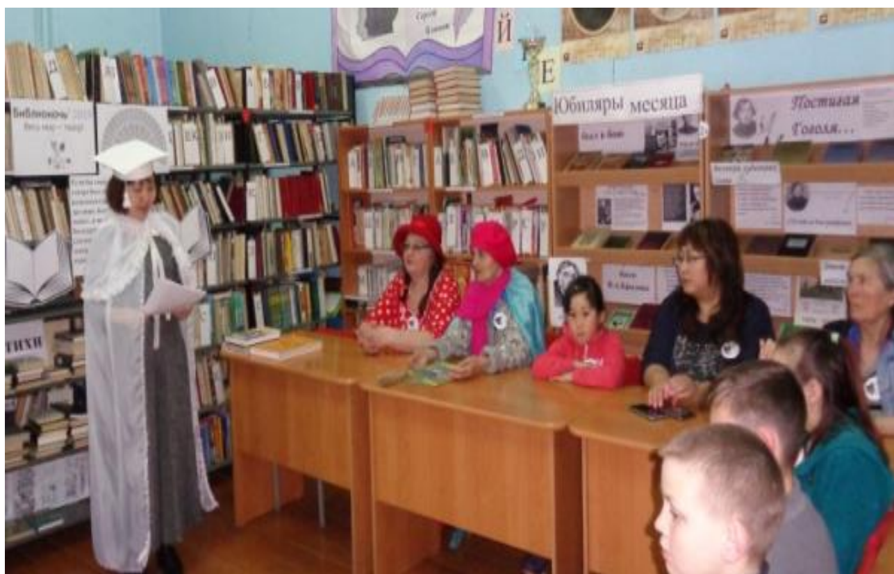
«Библионочь – 2019: Весь мир – театр!»