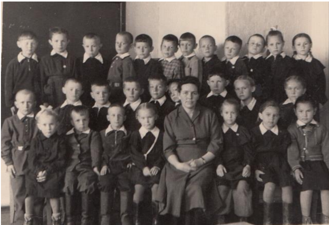
Ученики-октябрята 1 класса Малоарбатской школы. 1961 год

Каждый ребенок становился по достижению определенного возраста октябренком, пионером, комсомольцем. Принимали в октябрята 22 апреля, в день рождения В.И. Ленина.