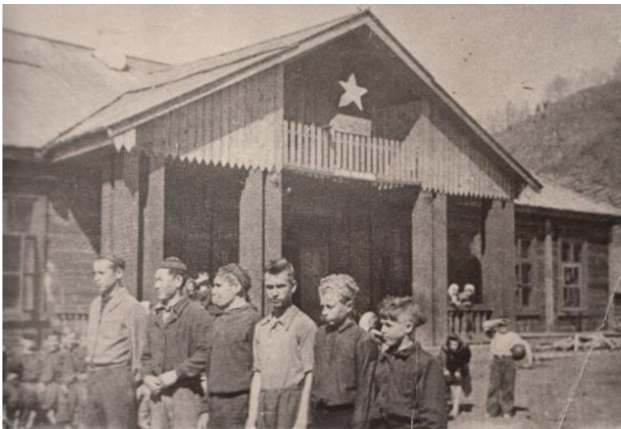
Волейбольная команда комсомольцев из Малых Арбатов. 1953 год