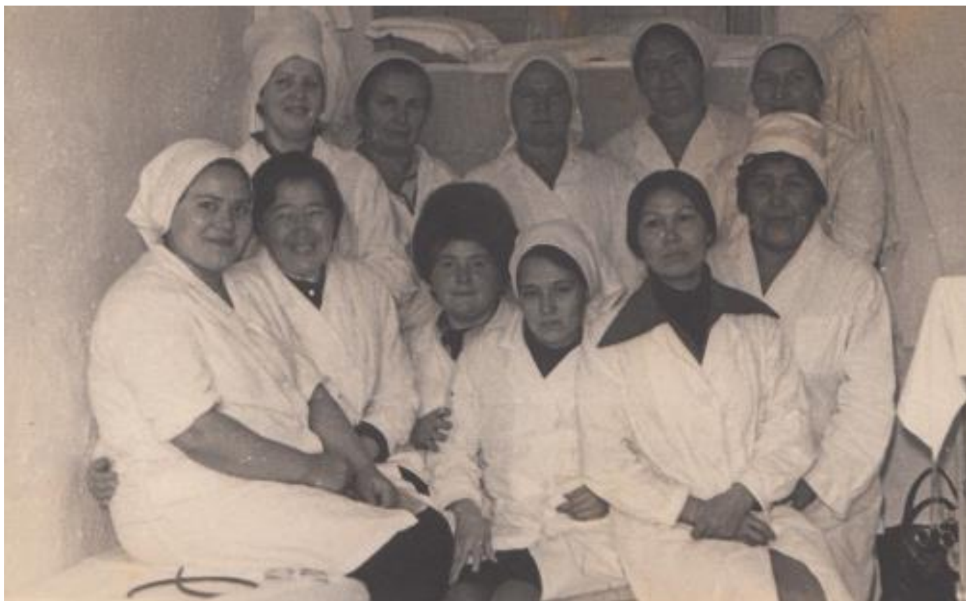
Коллектив Малоарбатской больницы