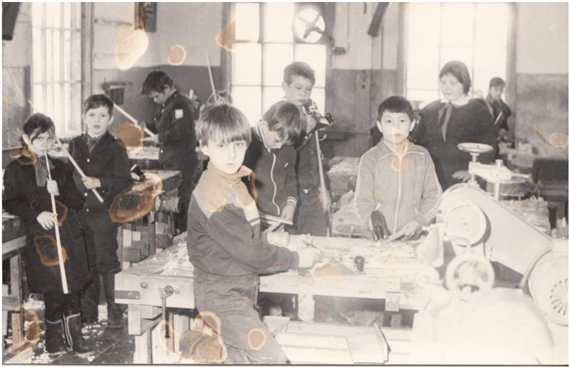
На уроках труда