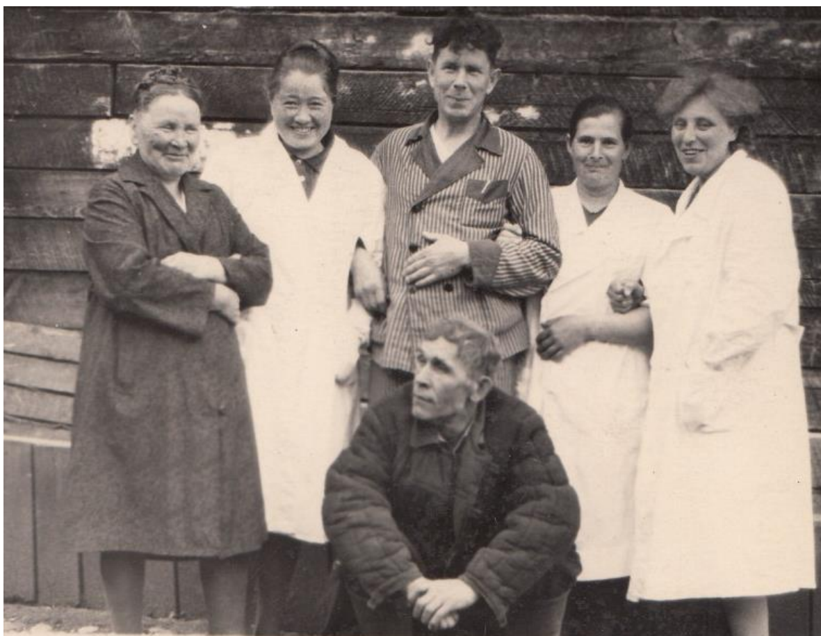
Медперсонал с больными