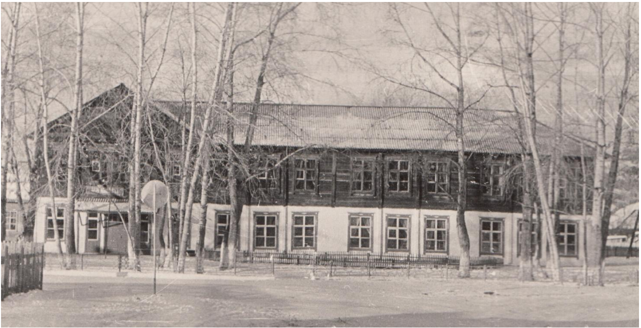
Здание школы в 80-х годах