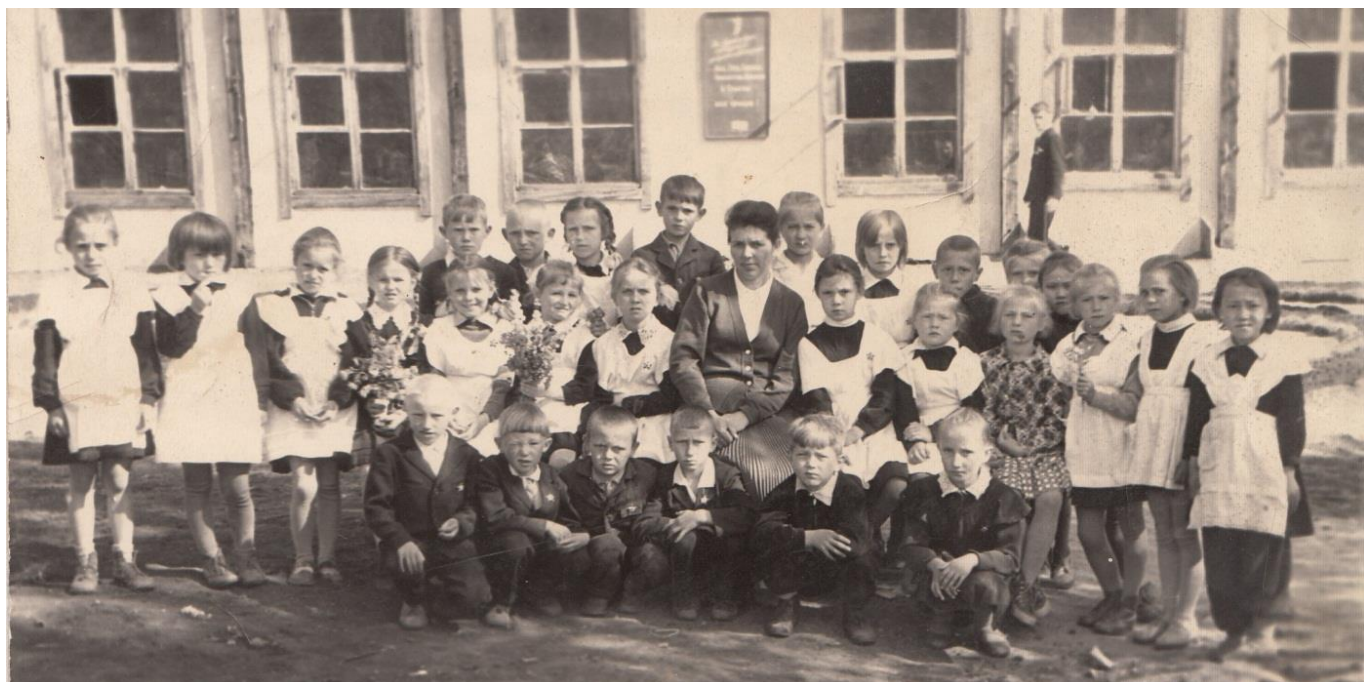
1 класс (Октябрята дружные ребята). 1964 год

При вступлении в октябрята ученики обязаны были знать правила октябрят. При вступлении в пионеры давали клятву, учили законы. Пионерам торжественно повязывали красный галстук.