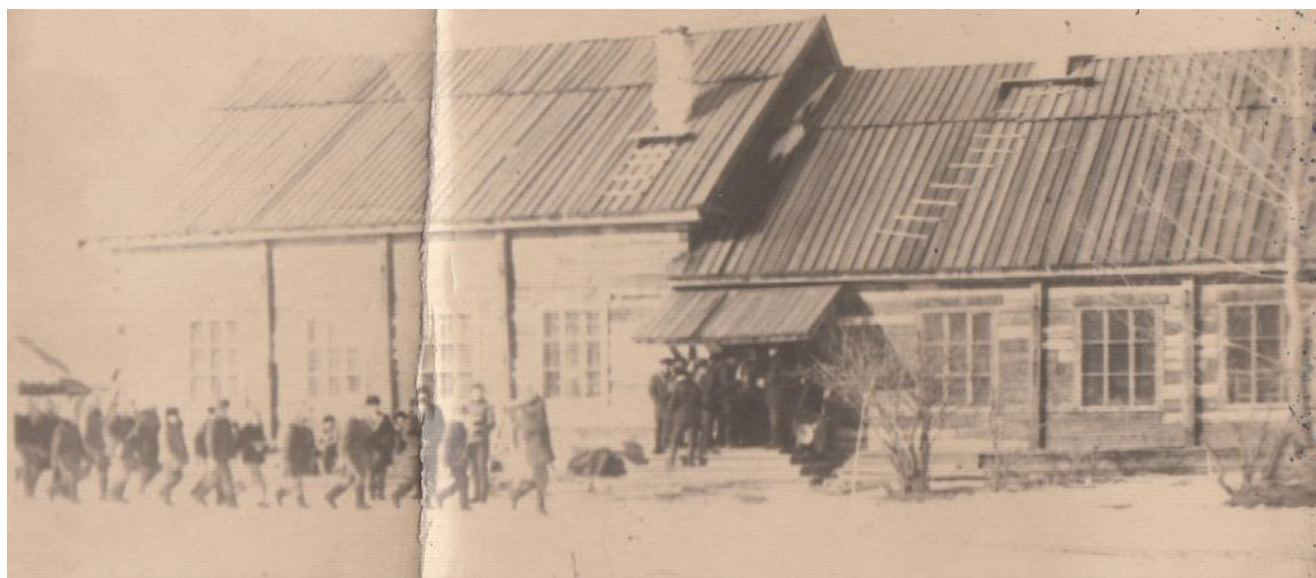
Спортзал и мастерские. 1959 год

В 1958 году в поселке Грязном разобрали большое здание, сломали печи, которым отапливалось помещение и из этого материала построили спортзал и мастерские для школы.