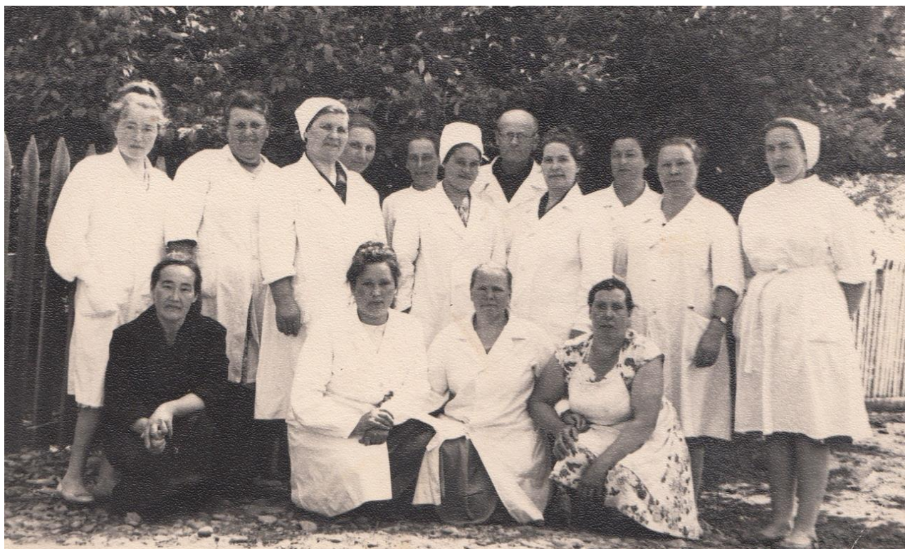
В центре заслуженный врач РСФСР Еремеев Степан Иванович