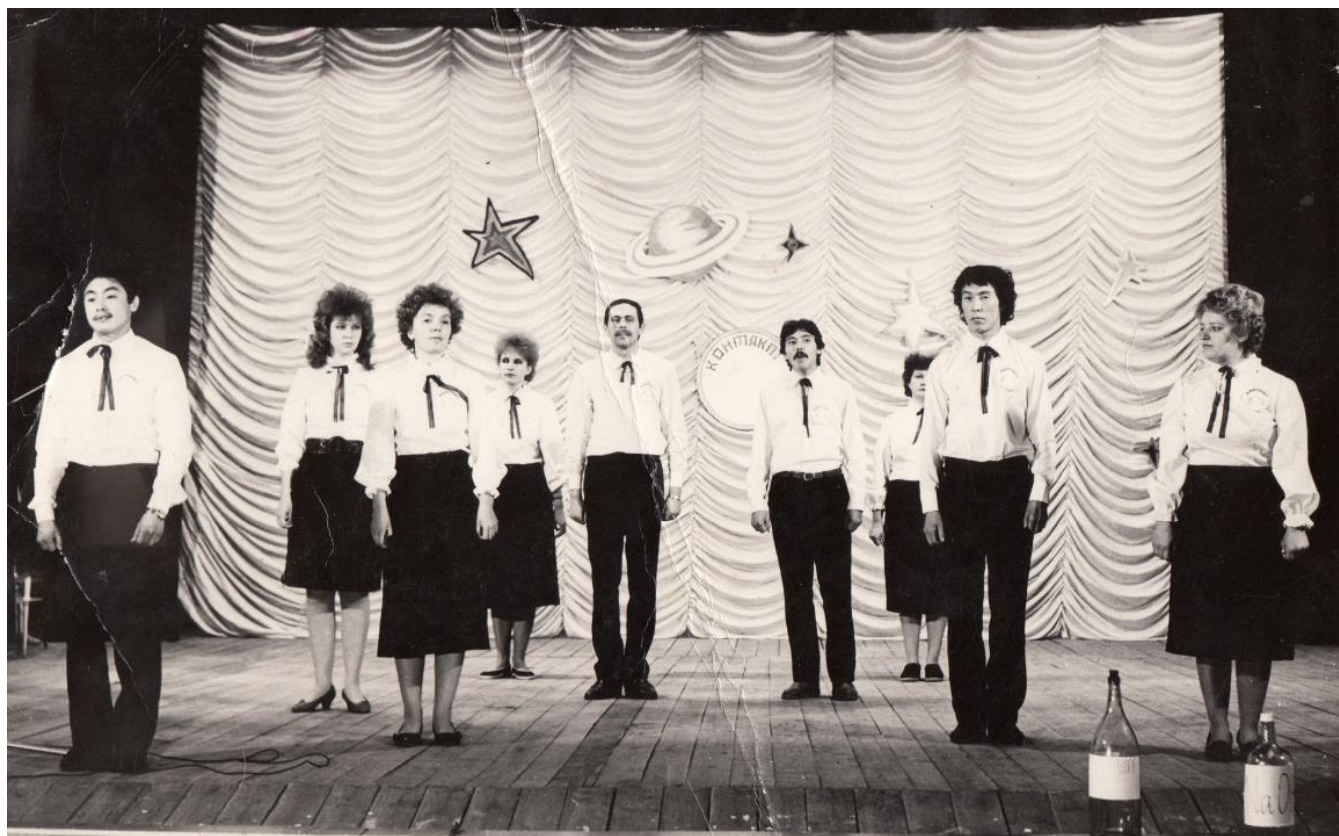
Агитбригада на сцене

В 1958 году в поселке Грязном разобрали большое здание, сломали печи, которым отапливалось помещение и из этого материала построили спортзал и мастерские для школы.