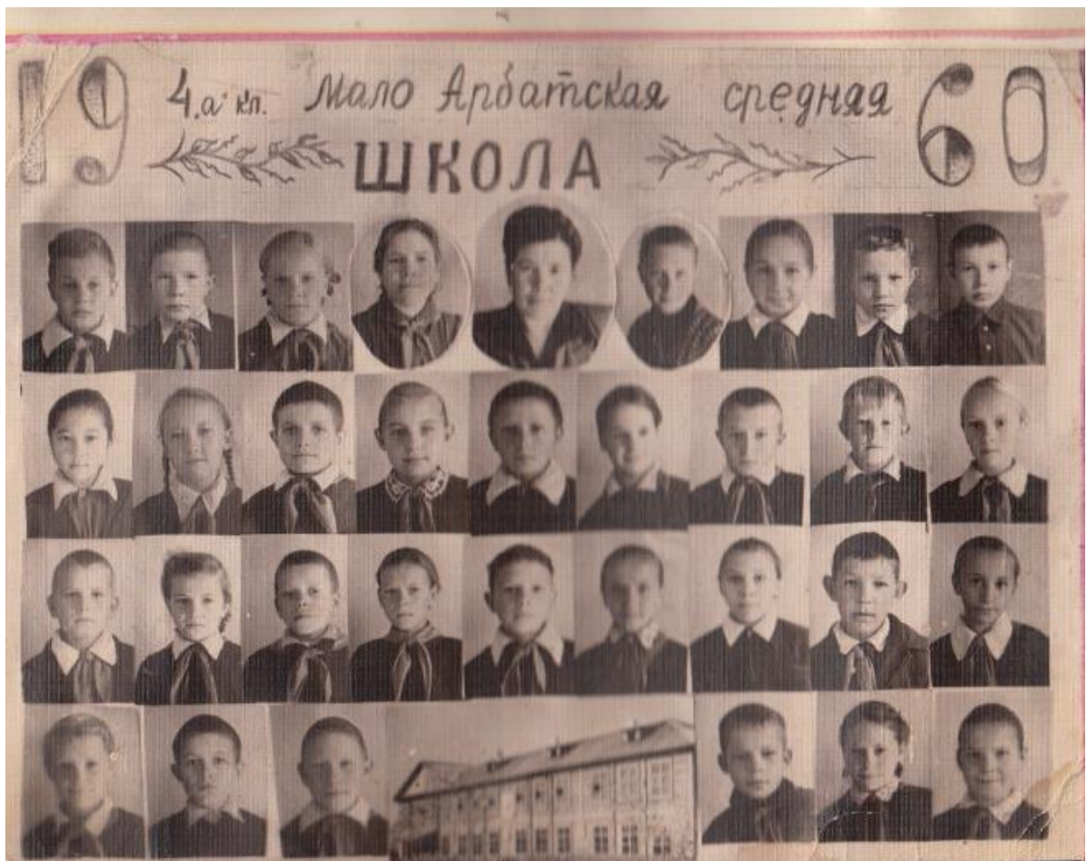
Пионеры 4 класса Малоарбатской школы. 1960 год