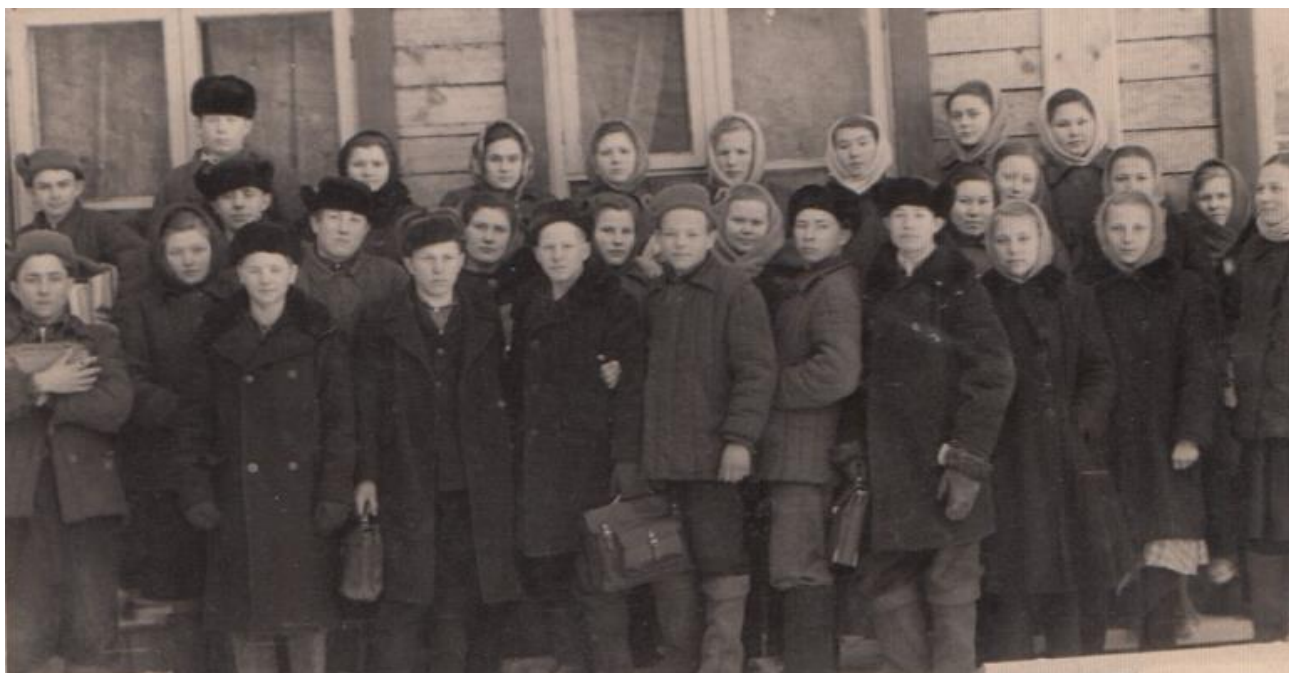
Комсомольцы 8 «а» класса. 1956 год