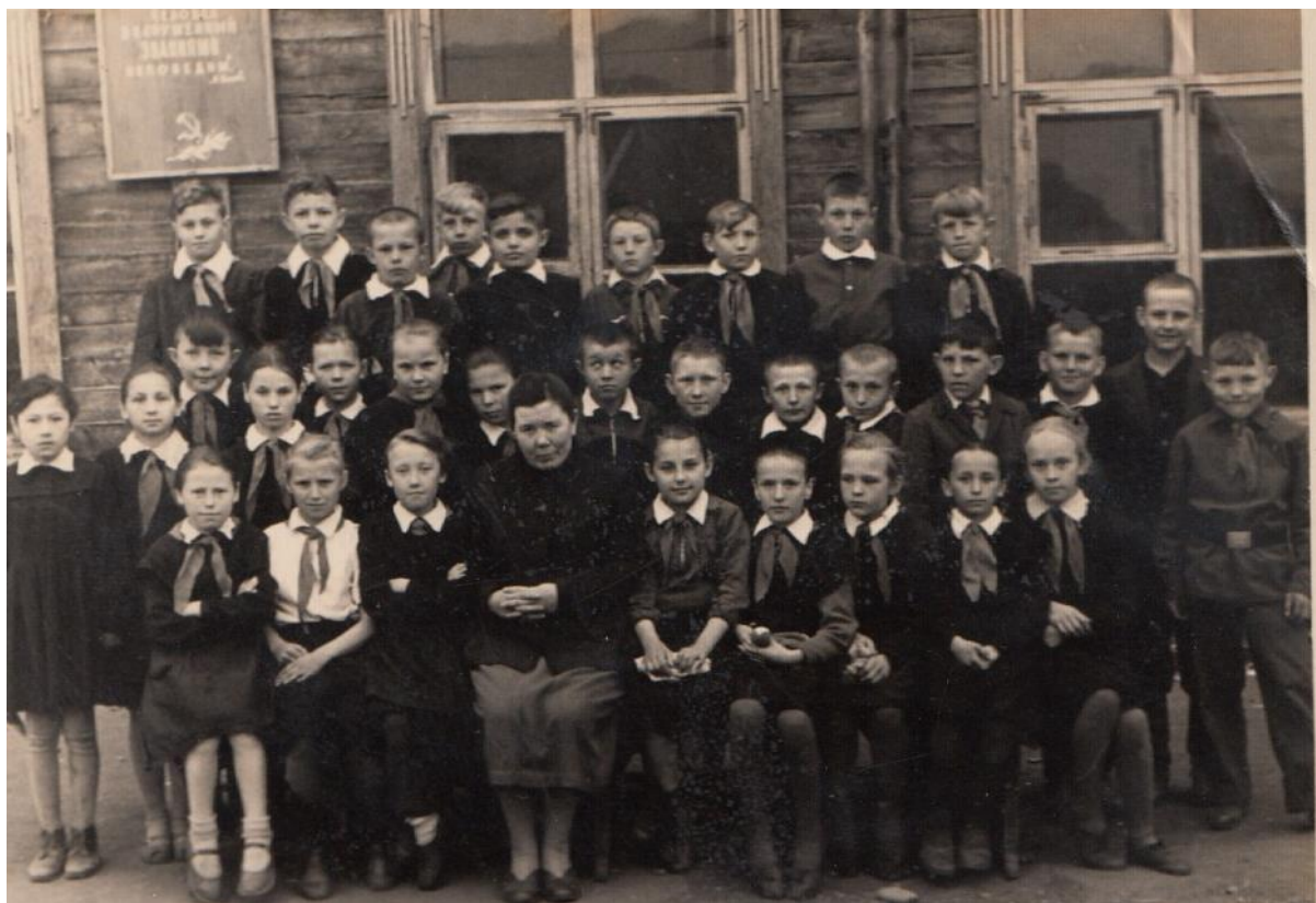
Пионеры Малоарбатской школы. 1961 год