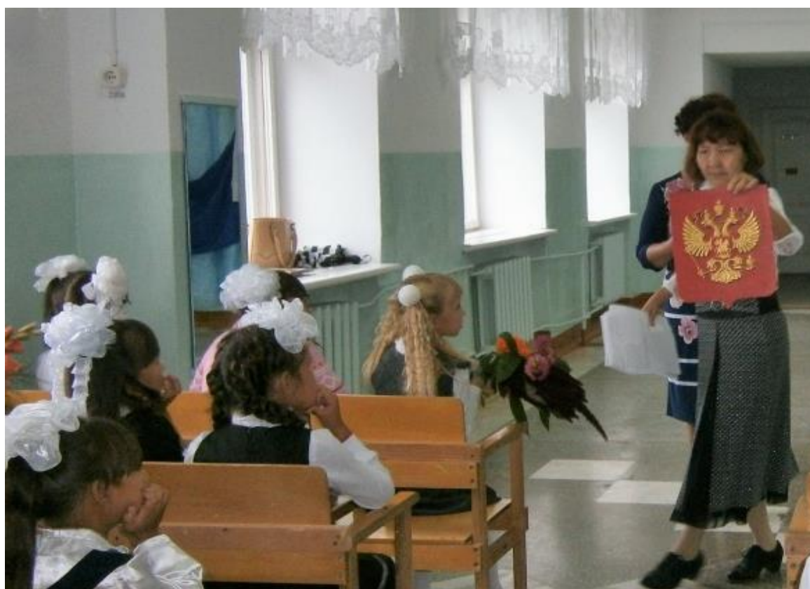
День Знаний, урок «Россия – Родина моя»