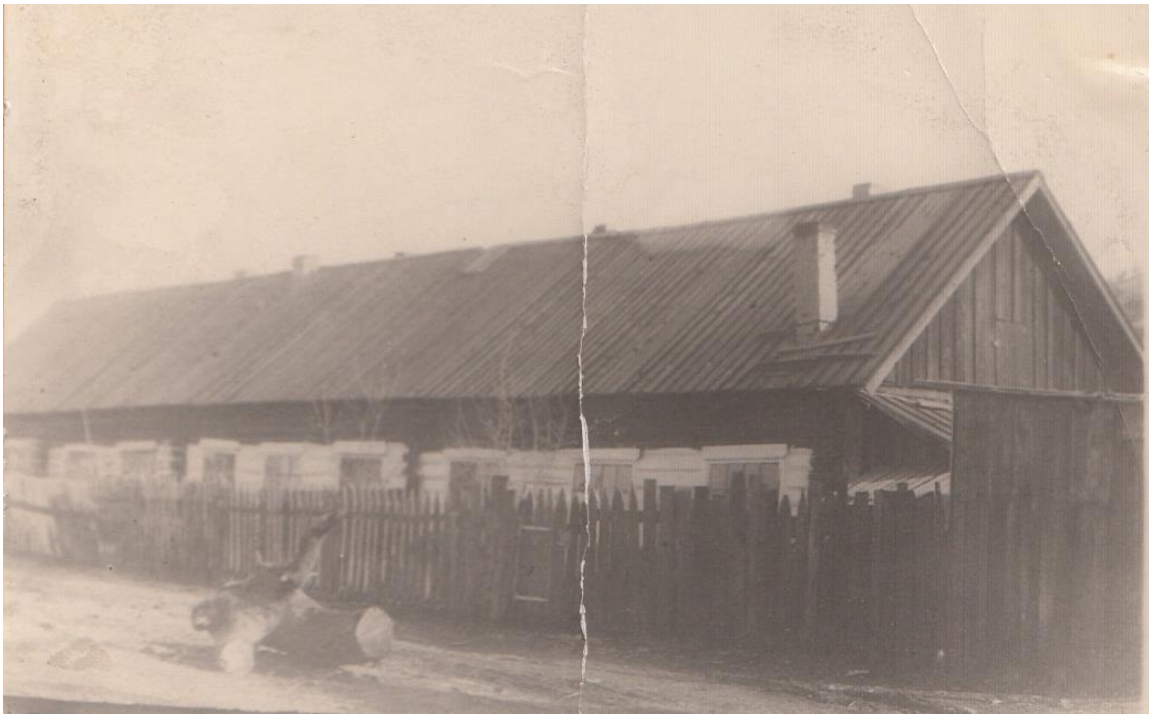
Первая школа Малых Арбатов. 1943 год