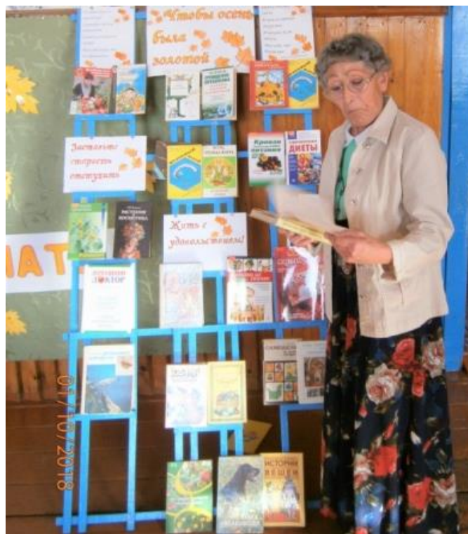
«У книжнай выставкі».

С 2011 года библиотека совместно с Малоарбатским СДК и Малоарбатской школой проводят разные мероприятия: встречи, праздники, познавательно-развлекательные мероприятия, обзоры литературы т.д.